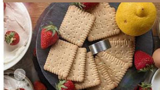
Pfälzer Cheesecake | Rezept aus Rheinland-Pfalz

Leicht, fluffig und schnell gemacht: entdecke unser Rezept für saftigen Zitronenkuchen, zum Beispiel mit frischen Zitronen aus der Pfalz.