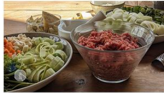
Kraftvolle Käse-Lauch-Suppe | Rezept aus Rheinland-Pfalz

Entdecke unser Rezept für eine deftige und kraftvolle Käse-Lauch-Suppe: ein