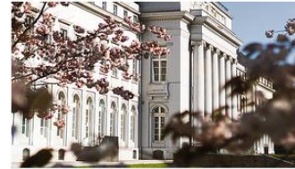
Koblenzer Kalte Ente | Rezept aus Rheinland-Pfalz

Entdecke unser Rezept für eine deftige und kraftvolle Käse-Lauch-Suppe: ein