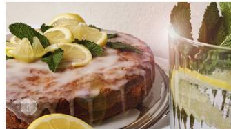
Saftiger Zitronenkuchen | Rezept aus Rheinland-Pfalz

Ein traditionelles und typisches Herbstgericht im Hunsrück und an der Nahe sind die deftigen und sehr sättigenden Gefüllten Klöße in