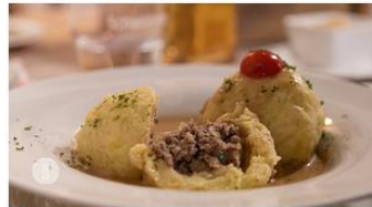
Hunsrück Gefüllte Klöße | Rezept aus Rheinland-Pfalz

Ein traditionelles und typisches Herbstgericht im Hunsrück und an der Nahe sind die deftigen und sehr sättigenden Gefüllten Klöße in