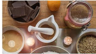
Gewürzkuchen mit Schokoglasur | Rezept aus Rheinland-Pfalz

Weihnachtsaroma pur: Mit unserem Rezept für weihnachtlichen Gewürzkuchen lässt du dir den Winter auf der Zunge zergehen.