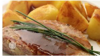
Pfälzer Saumagen | Rezept aus Rheinland-Pfalz

Ein typisches Gericht aus der Pfalz ist der traditionelle Pfälzer Saumagen – wir verraten dir das überraschend einfache Rezept zum Selbermachen.