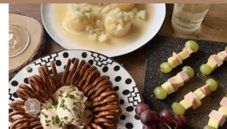
Dreierlei rheinhessische Klassiker | Rezept aus Rheinland-Pfalz

Rheinland-Pfalz trifft USA: Der Pfälzer Cheesecake mit frischen Erdbeeren ist unser fruchtiger Kuchen-Genusstipp im Sommer!